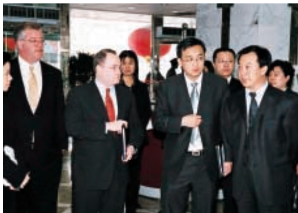
AIG專家考察本公司河北分公司

二零零四年度，本公司加大了市場調研和拓展力度，針對目標客戶群和特定渠道，開發個性化產品；積極推進與本公司戰略合作夥伴，AIG的合作，完善意外傷害保險產品，推出短期健康保險產品。